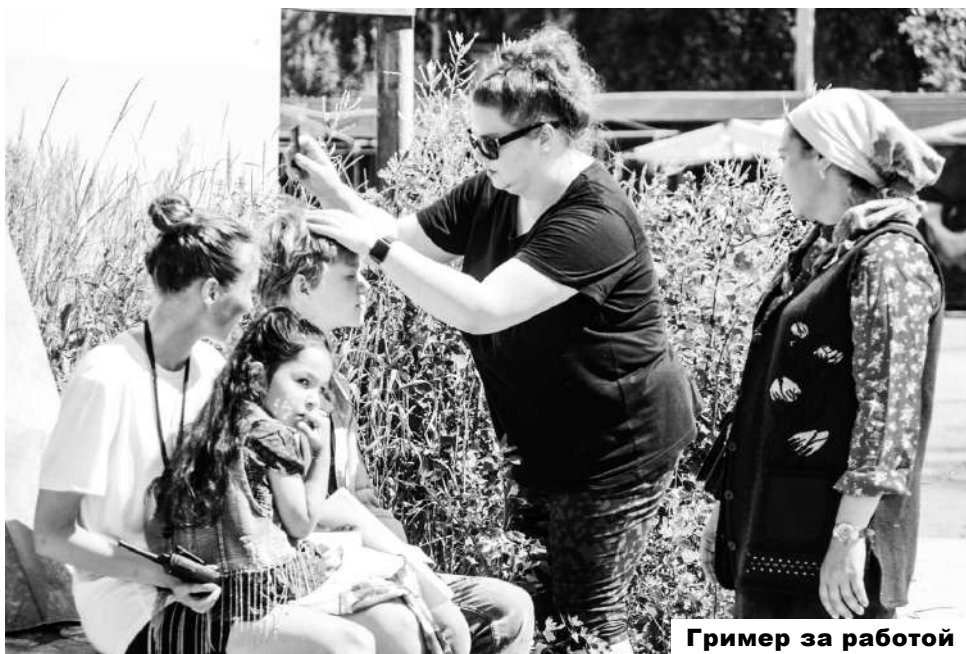
Гриммер за работой