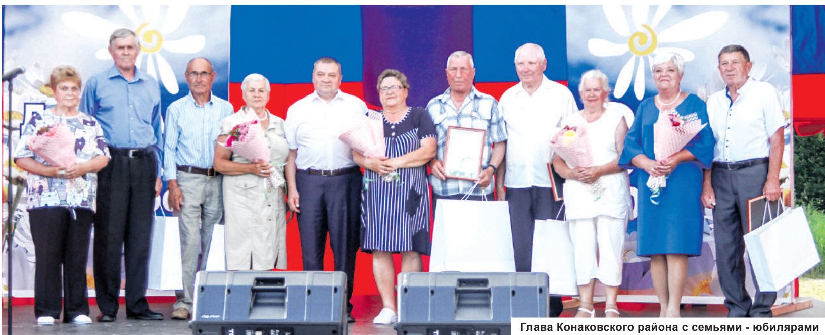
Глава Конаковского района с семьями - юбилярами