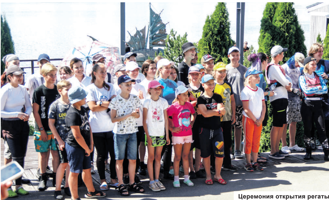
Церемония открытия регаты