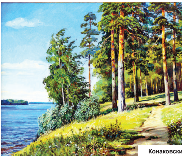
Конаковский бор на полотнах Н.Шитикова