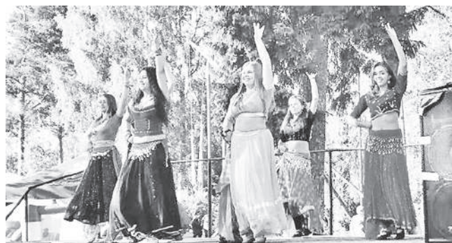
Подготовила Ирина Третьякова

Традиционно чувствуют в этот день людей, славно потрудившихся на благо своего поселения. В их адрес прозвучало много добрых и теплых слов. Лучшие из лучших поднялись на сцену, где в торжественной обстановке получили грамоты и памятные подарки. В этот день были отмечены трудовые коллективы первомайской больницы, пожарной части, почты, школы, ООО «Аввакумово», ООО «Русь». Благодарственные письма за финансовую и техническую помощь получили ЛОЦ «Александровская слобода», ЭКО-отель «Веточка», ООО «Волга-сервис». Церемонию награждения сопровождали яркие концертные номера: задумывшиеся лирические песни переплетались с веселыми, зажигательными танцевальными ритмами. Чем выше поднимался градус настроения, тем более активными становились зрители, которым очень понравились выступления артистов, ну а подтверждение тому - бурные и продолжительные аплодисменты.