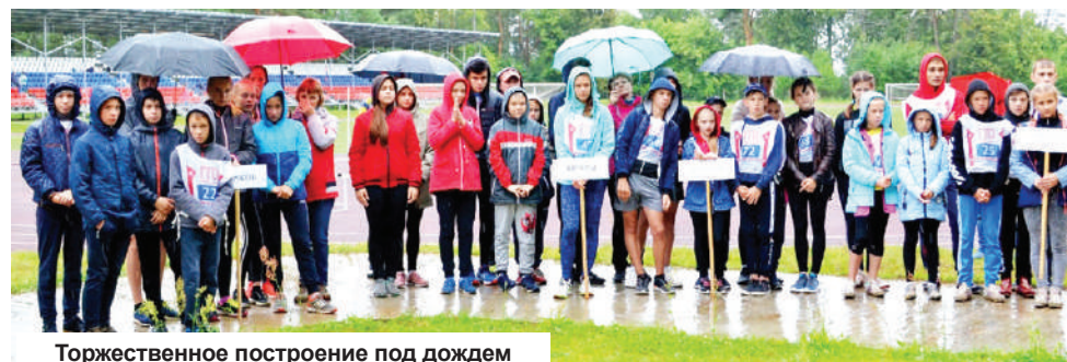
Торжественное построение под дождем

По результатам фестиваля будет сформирована сборная Тверской области, которая примет участие во Всероссийском фестивале ВФСК ГТО в МДЦ «Артек» (г. Ялта, Республика Крым).