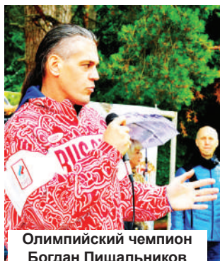
Олимпийский чемпион Богдан Пищальников

4 и 5 июля в Конаковском районе проходил региональный этап летнего фестиваля Всероссийского физкультурно-спортивного комплекса «Готов к труду и обороне» среди общеобразовательных учреждений. В фестивале приняли участие около 115 учащихся из 12 муниципальных образований Тверской области от 11 до 15 лет, относящиеся к III и IV ступеням ГТО.