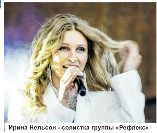
Ирина Нельсон - солистка группы «Рефлекс»