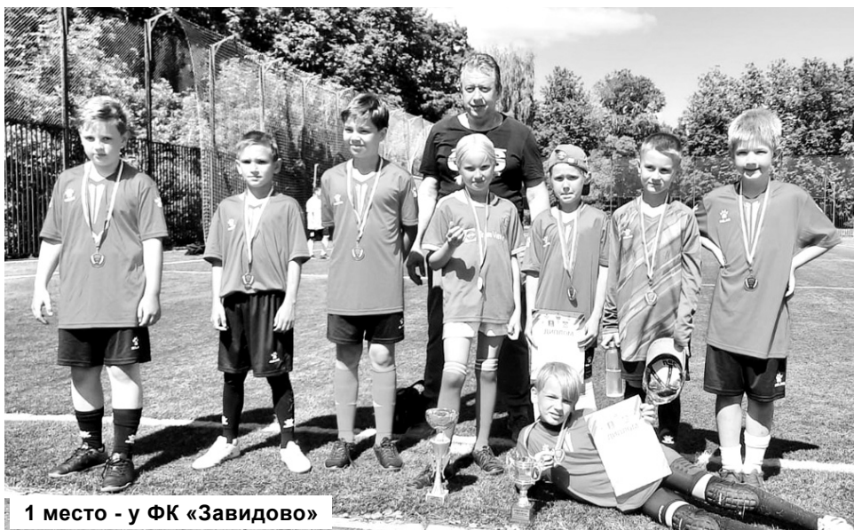
1 место - у ФК «Завидово»

Летом в России отмечают День молодежи - праздник, посвященный тем, от кого зависит будущее нашей страны.