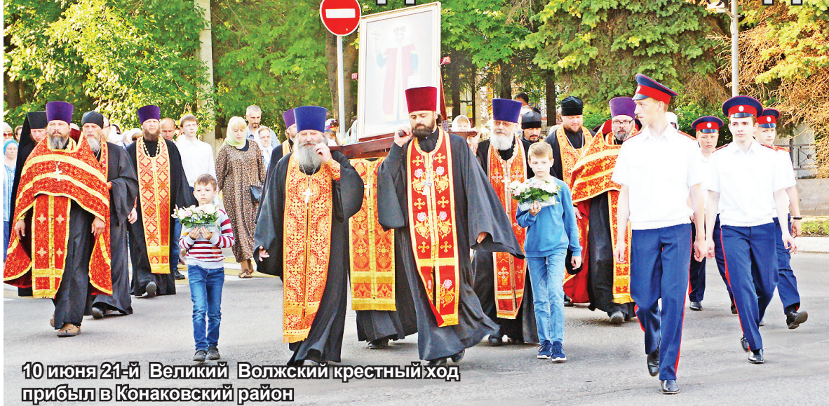
10 июня 21-й Великий Волжский крестный ход прибыл в Конаковский район