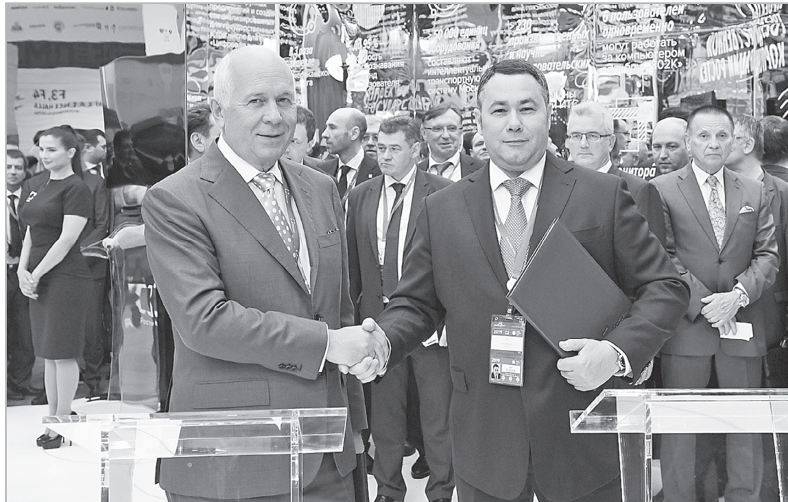
Соглашения, подписанные на ПМЭФ, обеспечат Тверской области устойчивое развитие

Итоги работы тверской делегации, которую возглавил губернатор Игорь Руденя, на Петербургском международном экономическом форуме-2019 впечатляют. Общий объем предполагаемых инвестиций составит около 55 млрд рублей. У нас построят завод по производству сжиженного природного газа, создадут центр ядерной медицины, проведут модернизацию транспортной инфраструктуры, возродят крупное стекольное производство, расширят бумажно-картонную фабрику, разовьют межрегиональный туристический маршрут. А еще будут мониторить лес из космоса и внедрять IT-технологии.