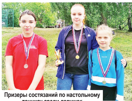
Призеры состязаний по настольному теннису среди девушек

них игра - это не только спорт, но и возможность встретиться в кругу друзей на природе. Да и погода, с утра огорчившая дождем, к обеду улучшилась, выглянуло солнце.