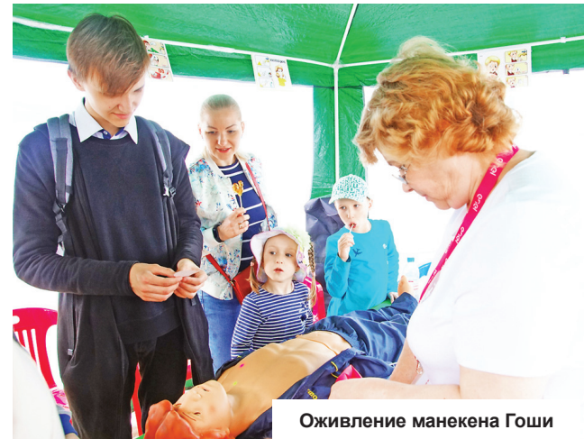
Оживление манекена Гоши

подопечными социальных фондов и По информации пресс-службы организаций. «Энел Россия».