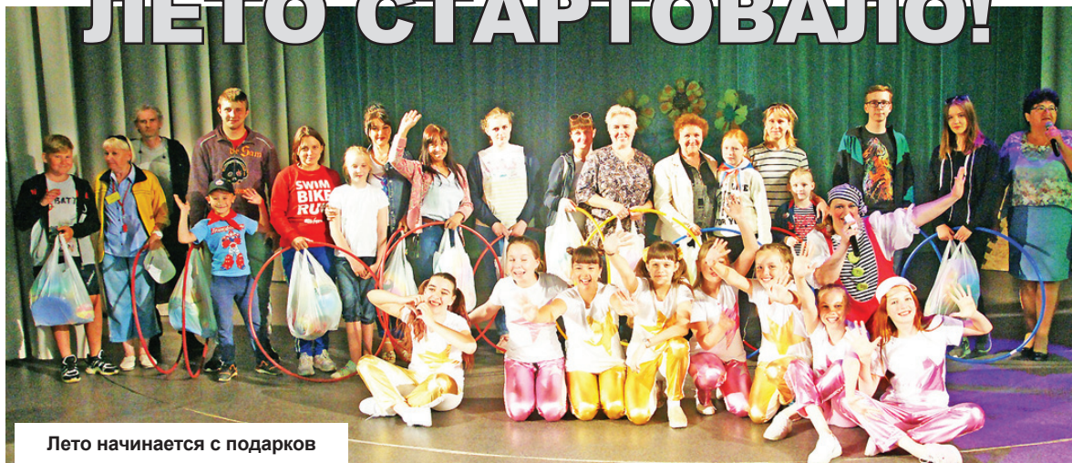
Лето начинается с подарков

И 3 июня в честь этого в районном Дворце культуры «Современник» прошел праздник открытия школьных лагерей, посвященный Международному дню защиты детей. Перед его началом была открыта фотовыставка газеты «Заря», посвященная прошедшему накануне празднику.