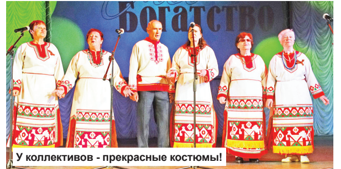
У коллективов - прекрасные костюмы!