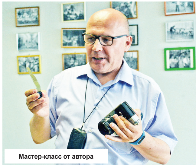
Мастер-класс от автора

Выставка ретро-фотографий и старой пленочной фототехники открылась в Международный день защиты детей 1 июня в выставочном зале Конаковской центральной межпоселенческой библиотеки.