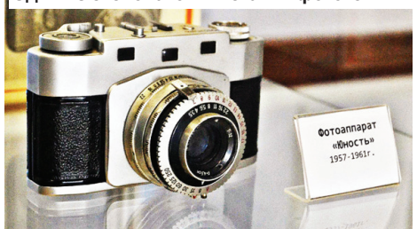
Один из экспонатов выставки фототехники

Нынешняя выставка не первая, ранее проект представлял себя в Конаковском краеведческом музее. Но именно эта выставка стала тематической: она была представлена детски-