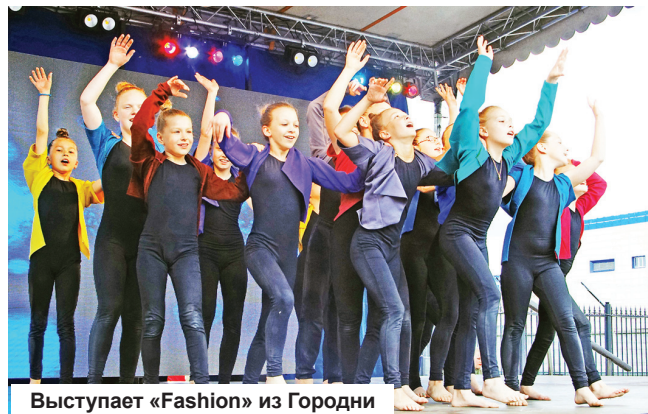
Выступает «Fashion» из Городни