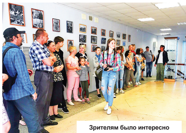
Зрителям было интересно

ми черно-белыми жанровыми и репортажными портретами 70 - 90-х годов. Помимо фотографий (а их было представлено более 70), в витринах выставочного зала демонстрировалась небольшая выставка пленочных фотоаппаратов с сопутствующей техникой.