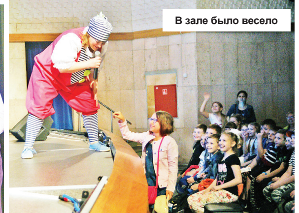
В зале было весело

В Международный день защиты детей 1 июня в Конаковском районе начали свою работу первые смены 32 лагерей, которые открылись при всех средних школах района, а также при учреждениях