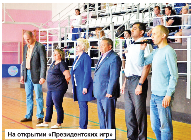
На открытии «Президентских игр»