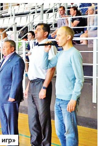
На открытии «Президентских игр»

А 3 июня на хоккейном корте автономной некоммерческой организации спортивного комплекса «Планета» г. Твери прошел заключительный этап «Президентских игр». В программе спортивных игр этого этапа - легкая атлетика и городошный спорт. И здесь команда из средней школы № 2 г. Конаково заняла третье командное место (на первом месте - команда из г. Твери (Центр образования №49), второе место - ЗАТО «Озерный»).