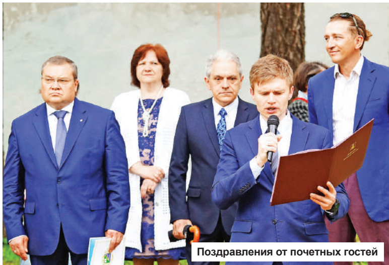
Поздравления от почетных гостей

Праздники последних школьных звонков прошли в прошедшую субботу, 25 мая, во всех школах Конаковского района. Нашему корреспонденту удалось побывать на двух из них.