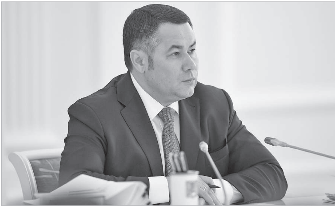
Игорь Руденя поставил задачу продолжить консолидацию активов в сфере теплоэнергетики

В прошлом году в Тверской области капитально отремонтировали и реконструировали 112 котельных, заменили 49