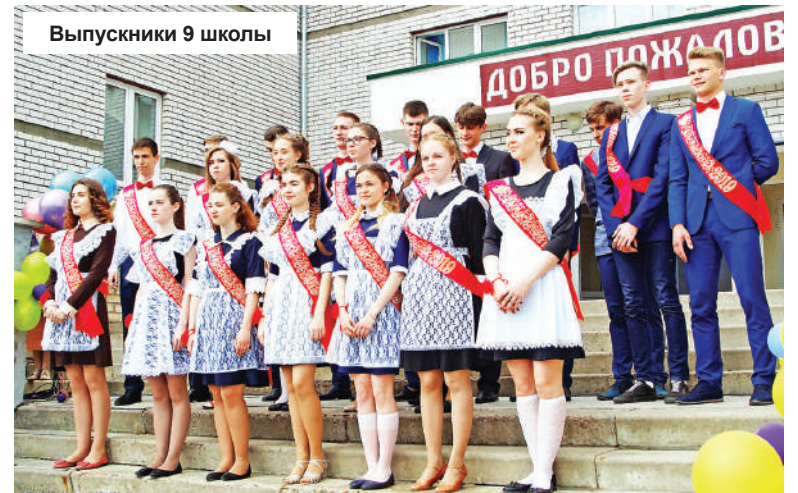
Выпускники 9 школы