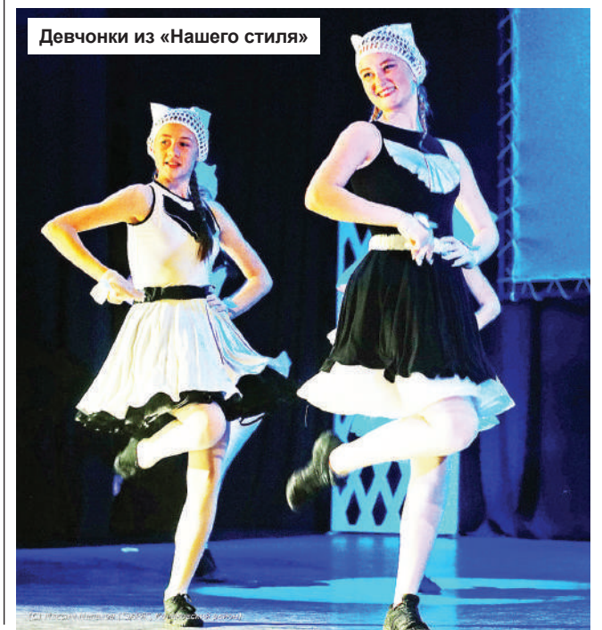
Девочки из «Нашего стиля»

определяют хореографические постановки в жанрах классического, народного и эстрадного танца. Репертуар коллектива насчитывает около 80 постановок. Разнообразие тематики, оригинальность номеров и композиционный, музыкальный и эстетический уровень, а также исполнительское мастерство воспитанников неизменно собирает множество зрителей, коллектив является постоянным участником всех концертных программ города и района.