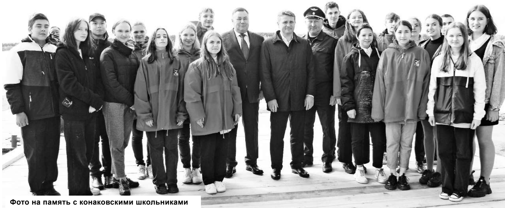
Фото на память с конаковскими школьниками

По информации пресс-службы правительства Тверской области.