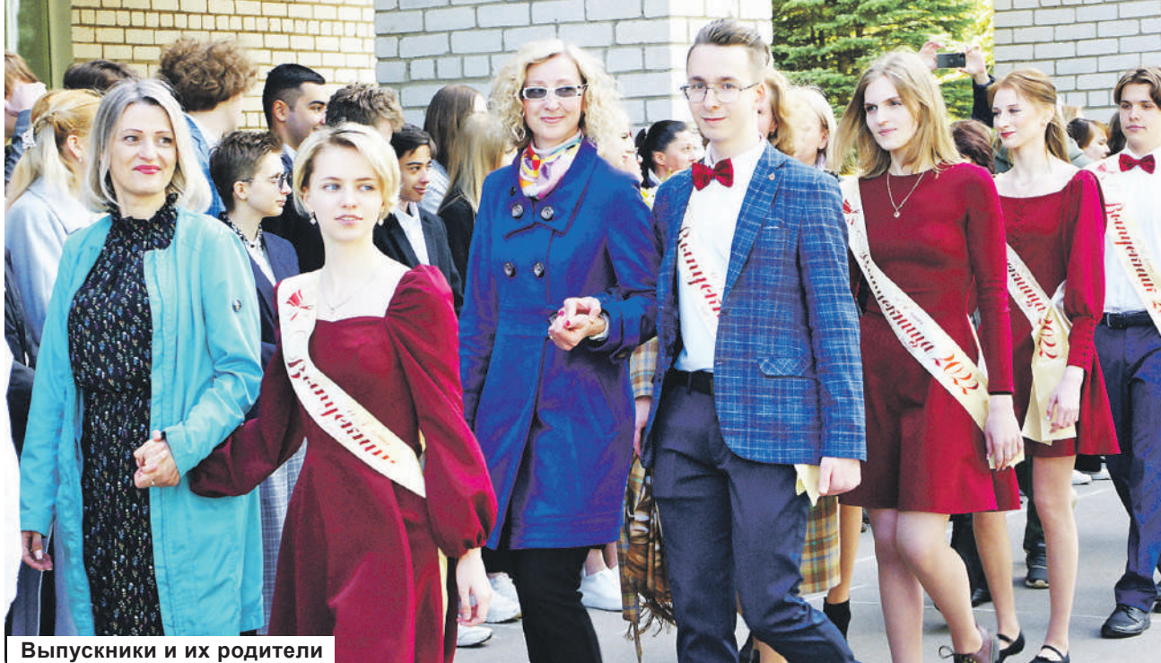
Выпускники и их родители

Александр СЛЕПЫШЕВ передал слова благодарности от председателя Законодательного собрания Тверской области Сергея ГОЛУБЕВА.