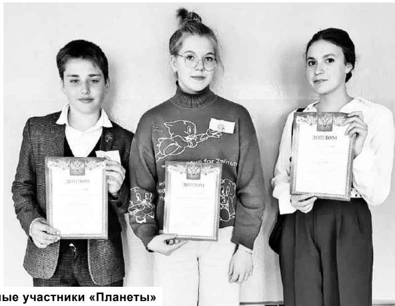
Самые активные участники «Планеты»