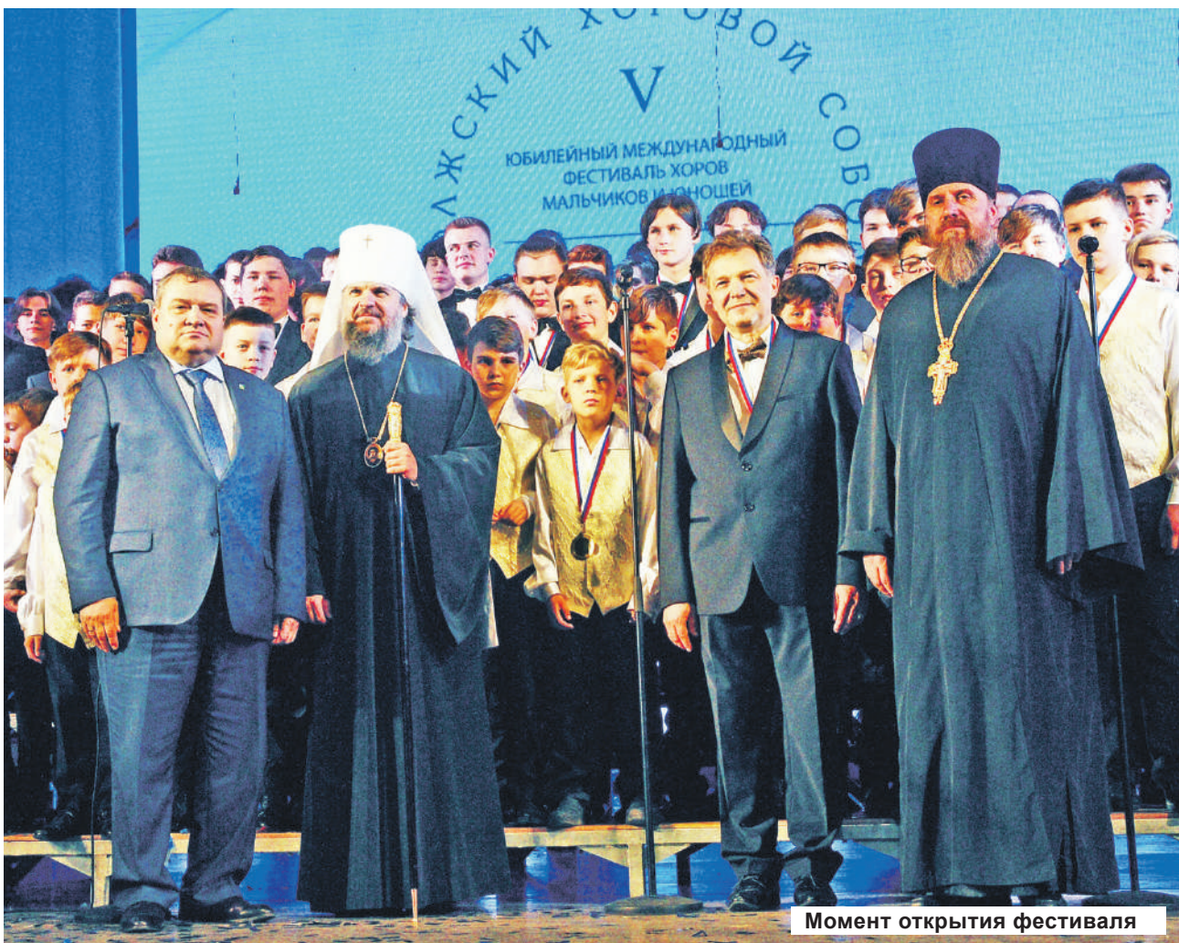
Момент открытия фестиваля

- Вы счастливые люди, потому что поете. По-