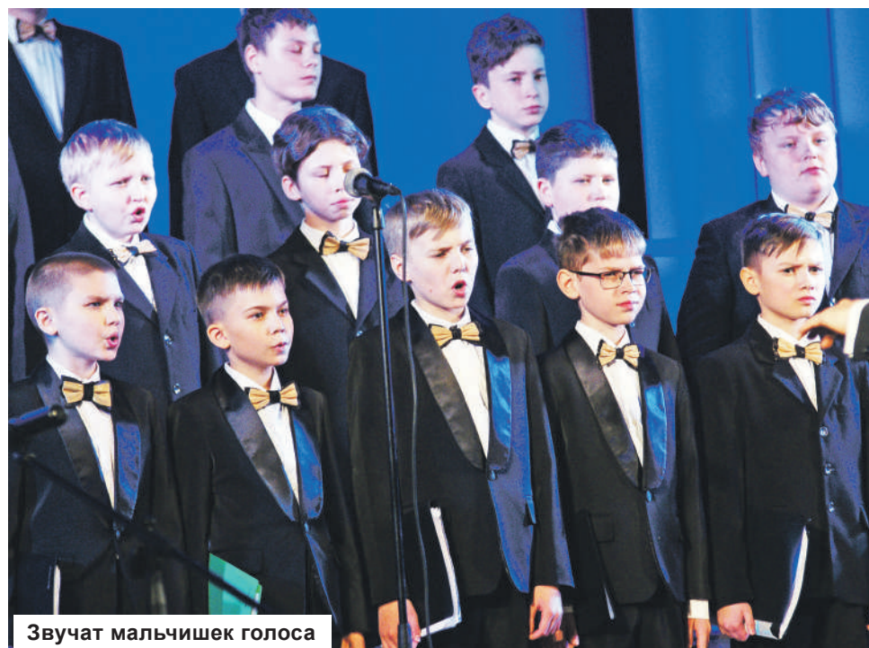
Звучат мальчишек голоса

Также, как сообщалось выше, фестивальные концерты прошли на нескольких площадках. Помимо г. Конаково, это Дом