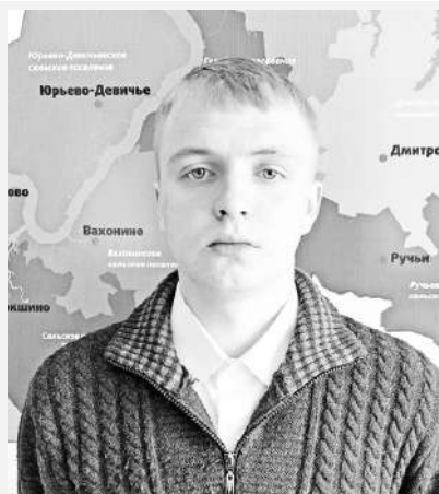
Подготовлено пресс-службой администрации Конаковского района

Родился 8 сентября 1996 года в п. Энергетик Конаковского района Тверской области в семье рабочих. Учился в средней школе № 1 города Конаково, средней школе № 2 города Зубцова, школе-интернате города Звенигорода Московской области. После 9 класса поступил в ПОУ «Колледж современного управления» в Москве по специальности «Право и организация социального обеспечения» и окончил его в 2018 году, получив специальность «Юрист». Проходил службу в МВД полицейским. С 2020 года - волонтер-юрист в благотворительных организациях. С мая 2022-го принят в администрацию Селиховского сельского поселения на должность исполняющего полномочия главы администрации. Не женат.