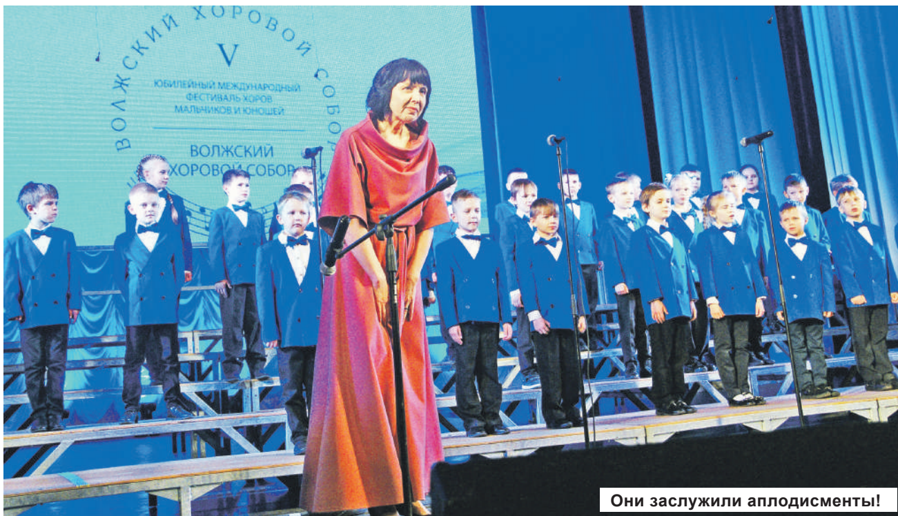
Они заслужили аплодисменты!

Подготовил Максим МАЛАХОВ.