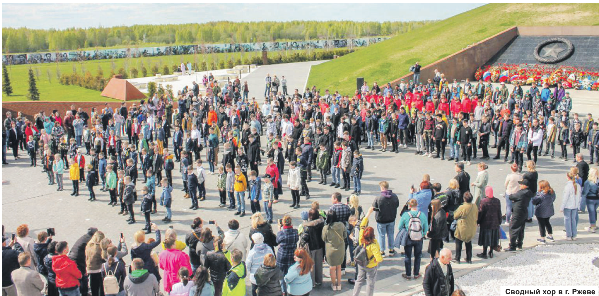
Сводный хор в г. Ржеве