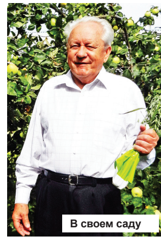
В своем саду