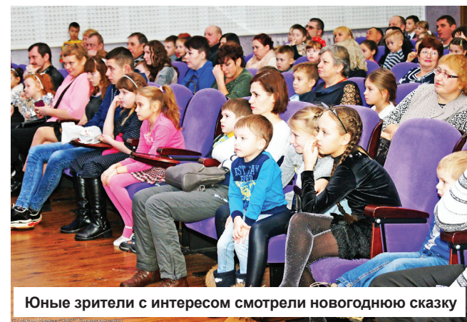
Юные зрители с интересом смотрели новогоднюю сказку

роз, который вернулся из своего сказочного царства с новой порцией подарков. Пойманный с поличным Снеговик испытал приступ стыда и был прощен (ведь не себе забрал, а зверьям раздал!). Ну а вторая порция новогодних подарков, конечно же, досталась маленьким зрителям. Такая вот новогодняя история со счастливым концом.