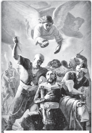
«Смерть великого князя Михаила Тверского». Худ. Пимен Орлов

Здесь все сказано. Не добавь, не убавь. Это единственная возможность сохранить мир на Земле, возможность сохранить Землю и для наших потомков.