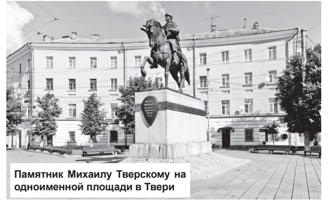
Памятник Михаилу Тверскому на одноименной площади в Твери

Прошли века. Казалось бы, все в истории народов уже было. Учись у своих предков, старайся не повторять их ошибок, как говорят в народе, «не наступай на те же грабли». Но все возвращается на круги своя. Как тут не провести исторические параллели. Мы, живущие уже в XXI веке, наблюдаем на постсоветском пространстве далекое средневековье. Появление множества мелких государств - та же раздробленная Русь, где каждый новый руководитель представляет себя удельным князем и готов повоевать с соседями. Мы являемся очевидцами того, что благодаря, конечно, своему экономическому и военному могуществу (откуда оно появилось - это уже особый разговор) роль великого ханства в современном мире присвоила себе администрация США. И даже не администрация, а определенная группа людей этой страны, в руках ко-