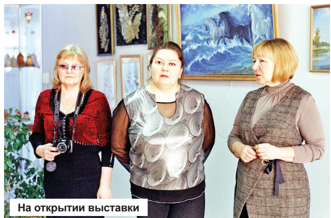
На открытии выставки

есть и те, кто регулярно участвует в этой, ставшей уже традиционной, выставке, есть и новички. А есть и маститые художники, которые по каким-