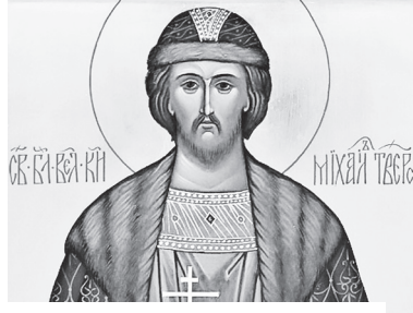
Князь Михаил Тверской (икона)

На правах сильного, беспощадного и хитрого поработителя ордынские ханы на протяжении двух с половиной веков умело пользовались и широко использовали княжеские усобицы, распри и войны русских князей. Ханы не только постоянно меняли свое мнение - кому передать ярлык на право быть Великим князем Руси, но и постоянно специально