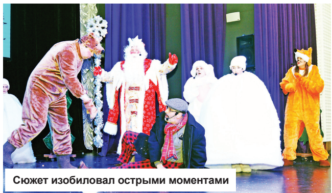
Сюжет изобилует острыми моментами

Новогодняя сказка с таким названием два дня шла в концертном зале АО «КЗСК» «Дом музыки». Спектакль поставлен силами педагогов Конаковского хоровой школы мальчиков и юношей и показан трижды!