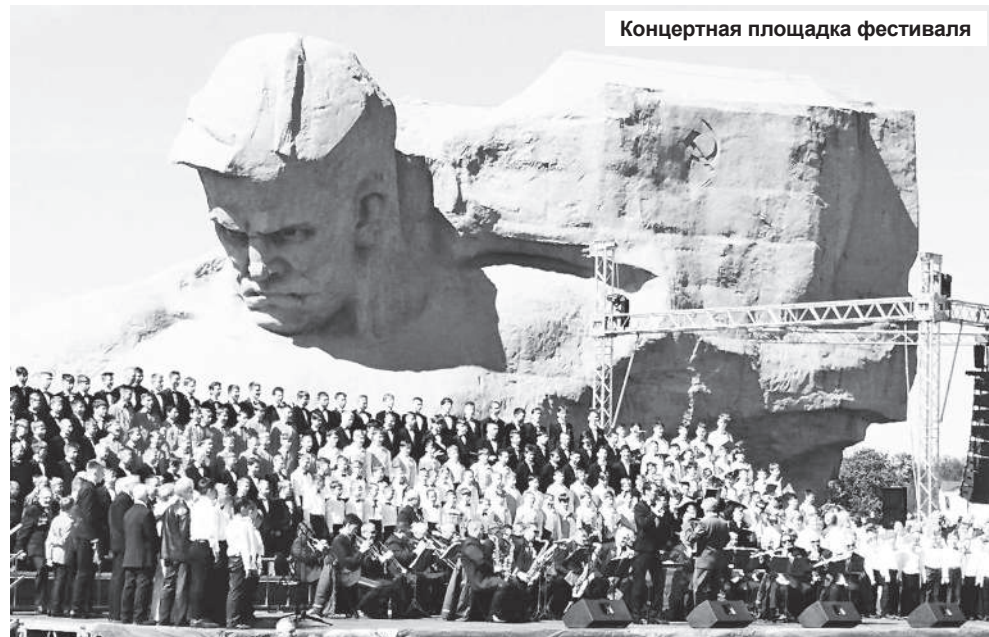
Концертная площадка фестиваля

В дни проведения фестиваля хористам было много рассказано о событиях первого дня Великой Отечественной войны. Мы осмотрели все достопримечательности мемориала Брестской крепости: и Вечный огонь, и катакомбы, в которых скрывались бойцы, - те, которые до последнего вздоха защищали Брестскую крепость, и орудия, которые использовались в годы войны. А в середине Брестской