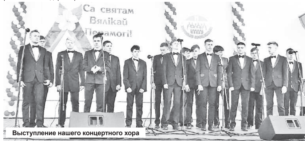
Выступление нашего концертного хора

А открытые военные машины времён Великой Отечественной войны привезли ветеранов, которым уже за 90 лет, и они заняли самые почётные места перед сценой. В торжествен-