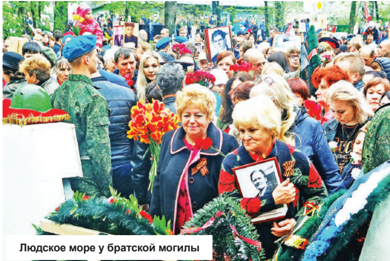
Людское море у братской могилы