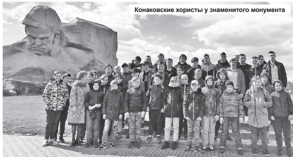
Конаковские хористы у знаменитого монумента