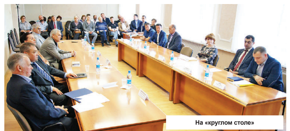
На «круглом столе»

деятельности регламентирован законодательно с точки зрения экологии и соответствующим образом лицензирован. Ответственность за «мусорную реформу» легла на плечи субъектов Федерации, в данном случае, на правительство Тверской области, которое сформировало исполнителя – регионального оператора. Именно он отвечает за сбор и вывоз мусора на немногочисленные полигоны ТБО. Что касается Конаковского района, то в силу его развития (туризм и сельское хозяйство) и географического положения (въездные ворота области со стороны Москвы), такого полигона у нас вообще быть не должно. Но пока идет переходный период, его роль играет Шумновский полигон ТБО, нагрузка на который в связи с закрытием второго такого же полигона в Шорново, в частности, его сбора, вывоза, утилизации и переработки. Данный вид