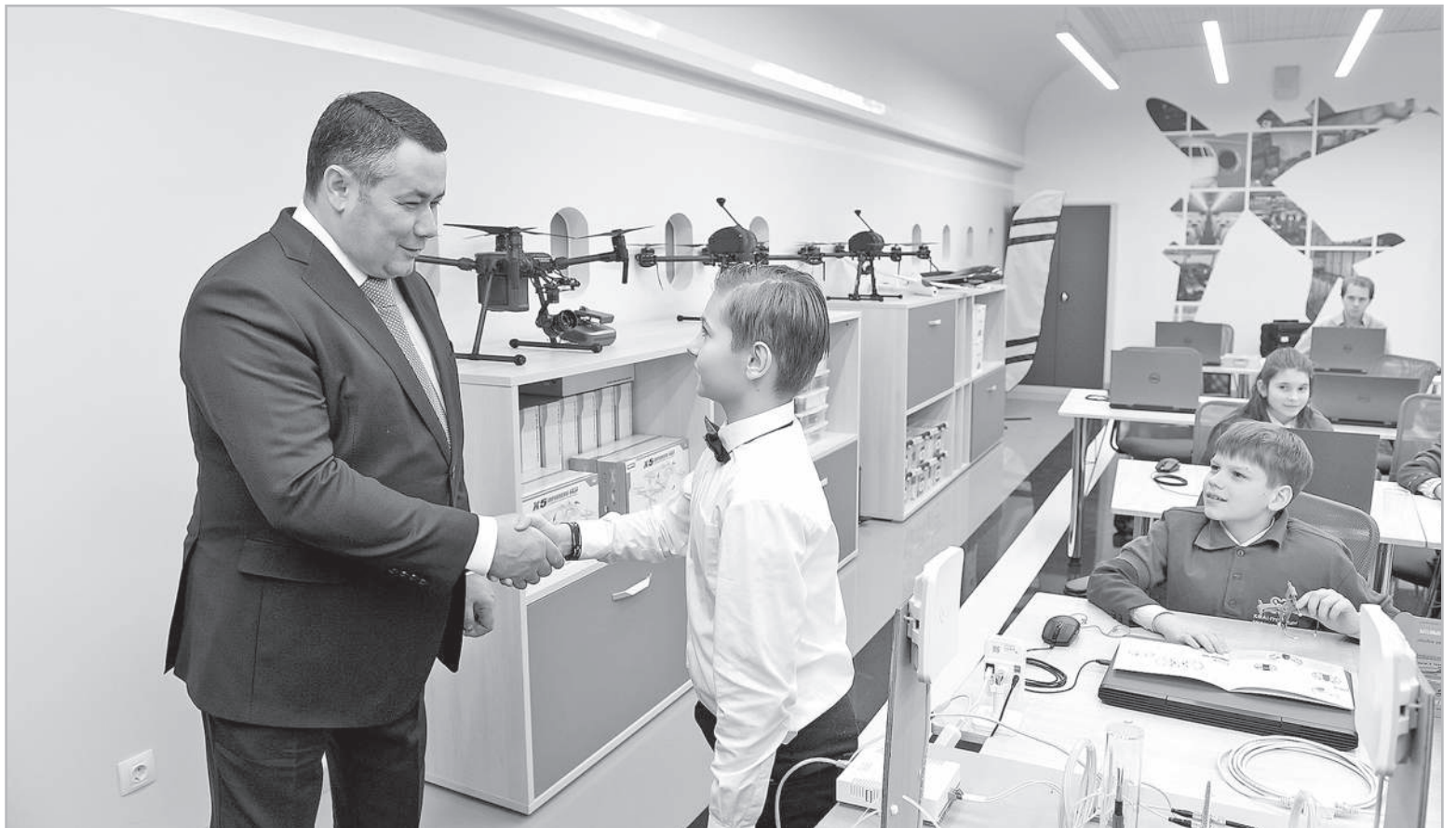
В Тверской области первый технопарк «Кванториум» начал работу в 2018 году

В рамках национального проекта «Образование» в Тверской области будут внедрять 8 региональных проектов. Это «Современная школа», «Успех каждого ребенка», «Поддержка семей, имеющих детей», «Цифровая образовательная среда», «Учитель будущего», «Молодые профессионалы», «Новые возможности для каждого» и «Социальная активность».