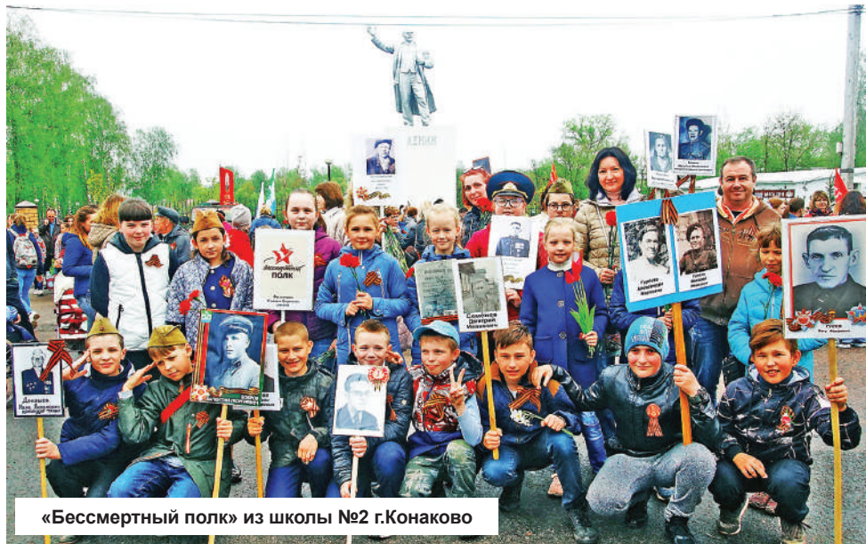
«Бессмертный полк» из школы №2 г.Конаково

вы. Ранее похожие акции под иными наименованиями проходили в других городах страны. Сейчас народное движение охватывает более 80 государств и