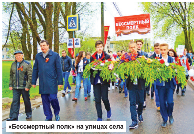
«Бессмертный полк» на улицах села

На площади перед Досуговым центром прошел конкурс песен военных лет среди детей «На солнечной поляночке». Юные таланты порадовали зрителей