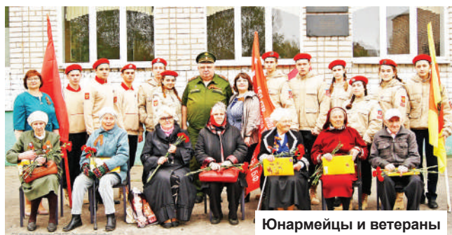
Юнармейцы и ветераны