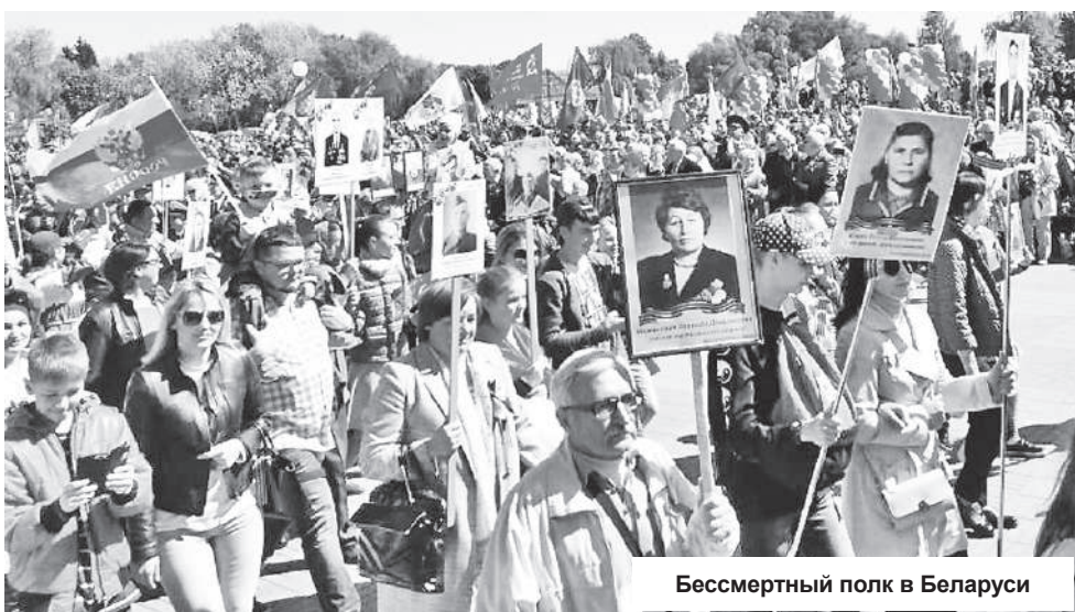
Бессмертный полк в Беларуси