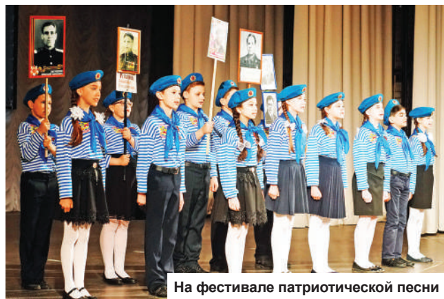
На фестивале патриотической песни

А 9 мая юнармейцы и волонтеры Победы приняли участие в торжественном митинге, посвященном празднику, после чего поехали к мемориалу сержанта Вячеслава Васильковского у д. Вябинки и возложили гирлянду.