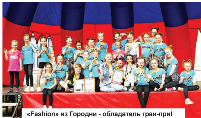
«Fashion» из Городни - обладатель гран-при!

В воскресенье, 12 мая, на площади перед районным Дворцом культуры «Современник» прошел гала-концерт лауреатов 47-го районного фестиваля искусств «Конаковские огни». Гран-при фестиваля получил (и мы убеждены, что заслуженно) творческий коллектив «Fashion» из Городни!