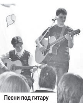
Песни под гитару

Дополнительная информация - в каб. №№ 2 и 5 Центра занятости населения Конаковского района.