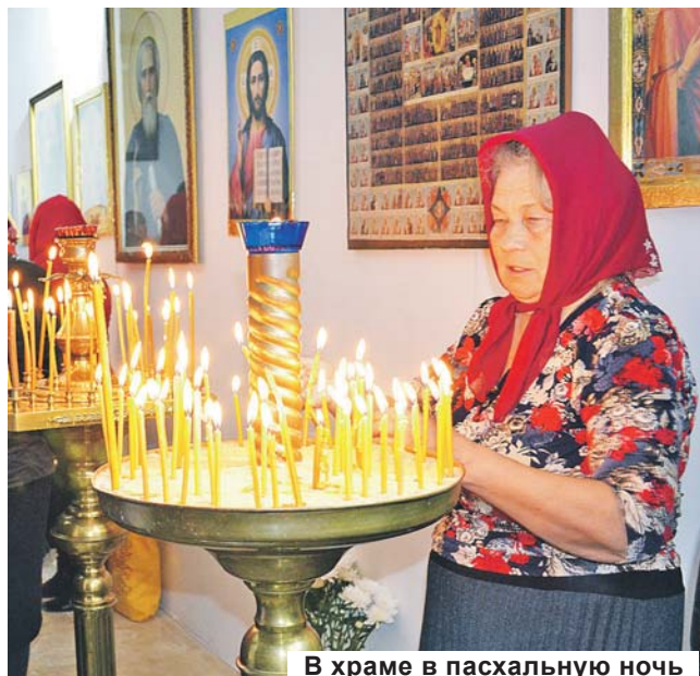
В храме в пасхальную ночь