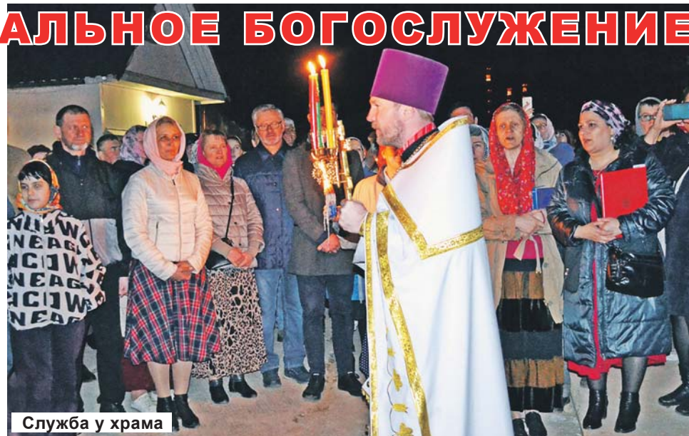
Служба у храма