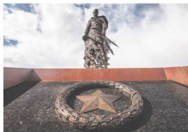
Верхневолжье – территория туризма