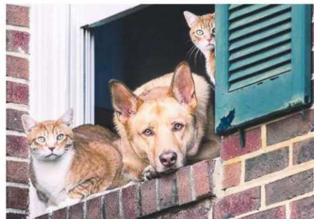
Бесплатная вакцинация животных 20 апреля