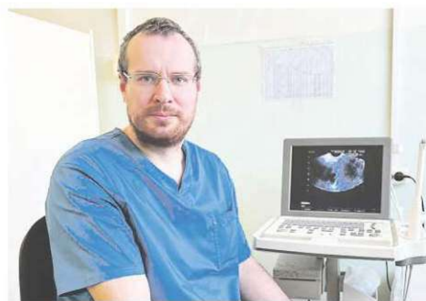
Интервью: новый заведующий гинекологическим отделением КЦРБ