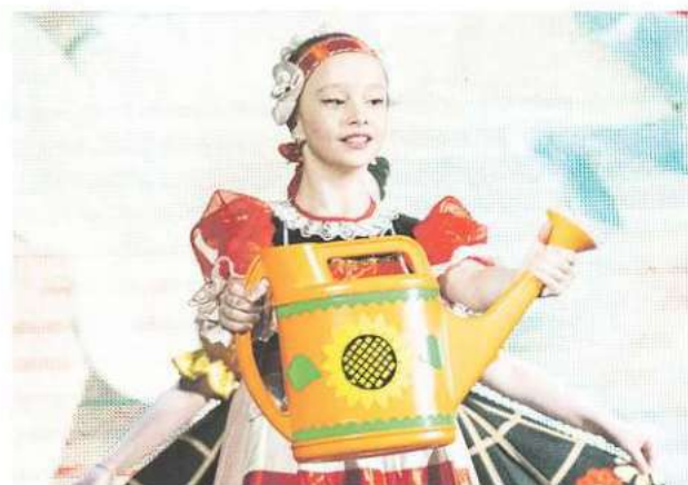
«Солнышко в ладошках»: итоги фестиваля