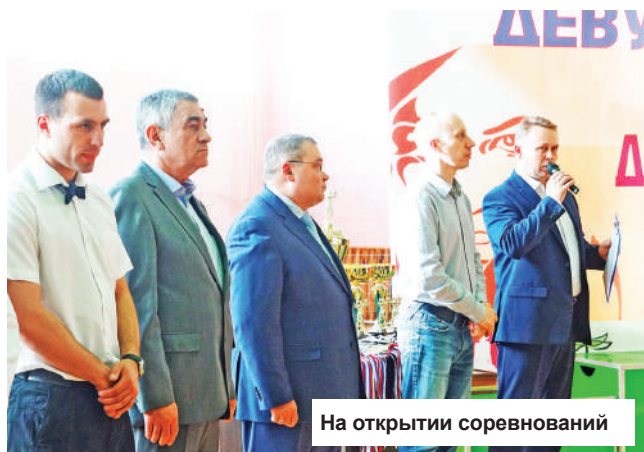
На открытии соревнований

В седьмой раз проходят на конаковской земле соревнования по боксу среди девушек «Виктория», посвященные Дню Победы. Официальный статус у них – областной, но по сути они давно уже стали межрегиональными, ведь в них принимают участие 30 команд – это около ста спортсменок из 14 регионов страны. Более того, второй год к нам приезжают юные спортсменки из Риги (Латвия), и тут уже впору задуматься о международном статусе соревнований.