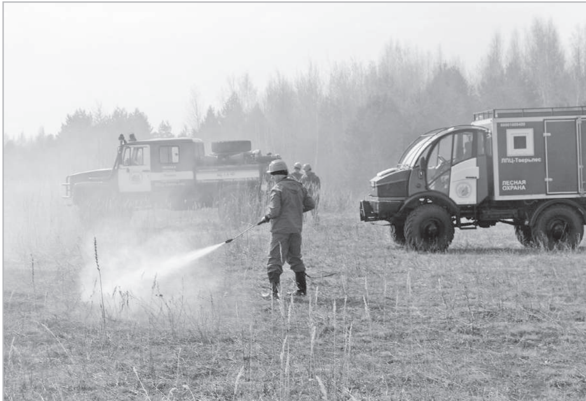
В регионе к борьбе с огнем готова хорошо оснащенная группировка противопожарных сил и средств

В прошлом году впервые за долгое время торфяных пожаров удалось избежать. А вот лес