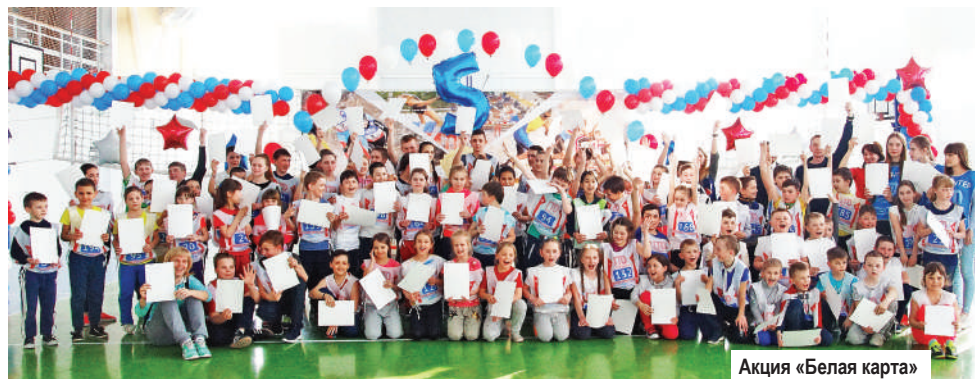
Акция «Белая карта»

Пока судейская коллегия считала места, дети и педагоги тоже времени даром не теряли. Решено было провести флешмоб «Белая карта». Акция с таким названием сейчас проводится повсеместно, и ее символический смысл такой: надо сфотографироваться группой с белой картой в руке (ее роль выполнял лист белой бумаги) в противовес красной карте, которая означает самое серьезное нарушение, допущенное спортсменом в футболе. А белый цвет, напротив, символизирует честность и конструктивный