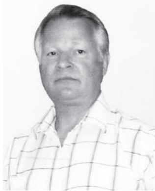
Госстроя РФ. Где бы ты ни трудился, до сих пор тебя вспоминают как доброго и отзывчивого человека, грамотного руководителя.

секретного испытательного полигона систем космической связи (более известного конаковцам как гидрометеопункт – ГМП). И, наконец, в бурные и противоречивые 90-е с нуля создал Конаковский жилищный фонд, в зону ответственности которого входили все муниципальные жилые дома города. И не только создал: вывел его в передовые среди аналогичных предприятий в городах с численностью населения до 150 тысяч человек, о чем свидетельствует Диплом первой степени