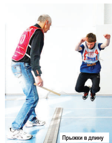
Прыжки в длину