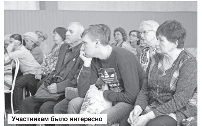
Участникам было интересно