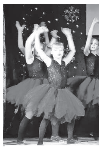
Концерт в Ручьевском СДК

- Основные проблемы связаны с нехваткой средств. Думаю, никто не станет оспаривать тот факт, что сфера культуры во все времена нуждалась в государственной поддержке и финансовых вливаниях. Да и в будущем вряд ли она станет полностью самокупаемой. Хочу отметить, что чем лучше будет экономическая ситуация в районе, тем больше средств мы сможем выделять на развитие культуры. Ведь она, по сути, не приносит материальной прибыли, но зато выигрывает значительно больше, чем экономический эффект, - это состояние умов, воспитание молодежи и, в целом, нравственное здоровье всей нации.