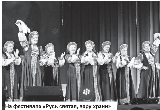
На фестивале «Русь святая, веру храни»

Главные факторы, влияющие на эффективность работы учреждений культуры района - слабая материально-техническая база, морально устаревшее оборудование, нехватка помещений, недостаточность средств на проведение косметического или капитального ремонта зданий. В настоящее время темпы износа зданий учреждений культуры и образовательных учреждений в области культуры продолжают отставать от темпов проведения реконструкций и капитальных ремонтов. Если у поселения скудный бюджет, то финансирование осуществляется на минимально достаточном уровне - это только зарплата сотрудникам по МРОТ и расходы на коммунальные услуги. А на укрепление материально-технической базы, увеличение ставок