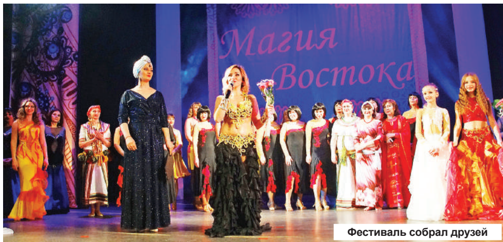
Фестиваль собрал друзей

В субботу, 23 марта в районном ДК «Современник» прошел очередной фестиваль восточных танцев «Магия Востока».