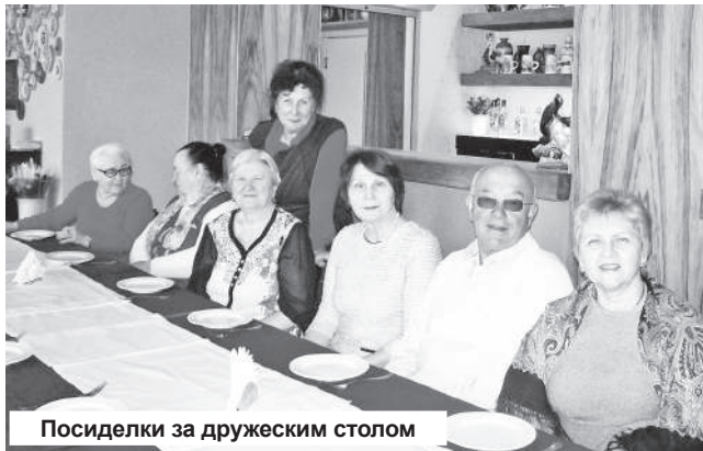
Посиделки за дружеским столом