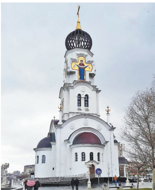
1 января, 2022 год. Храм Петра и Февронии. Город Новоросийск.

Адрес: г. Конаково, ул. Народная, 13; пр. Ленина, 4. Телефоны 8 (48242) 4-26-68, 3-74-54, 8-920-694-35-43 e-mail: konakovo_ckt@list.ru наша группа в контакте: vk.com/avtoshkola_konakovo ЗАПИСАТЬСЯ НА ОБУЧЕНИЕ МОЖНО НА САЙТЕ! www.konstk.ru