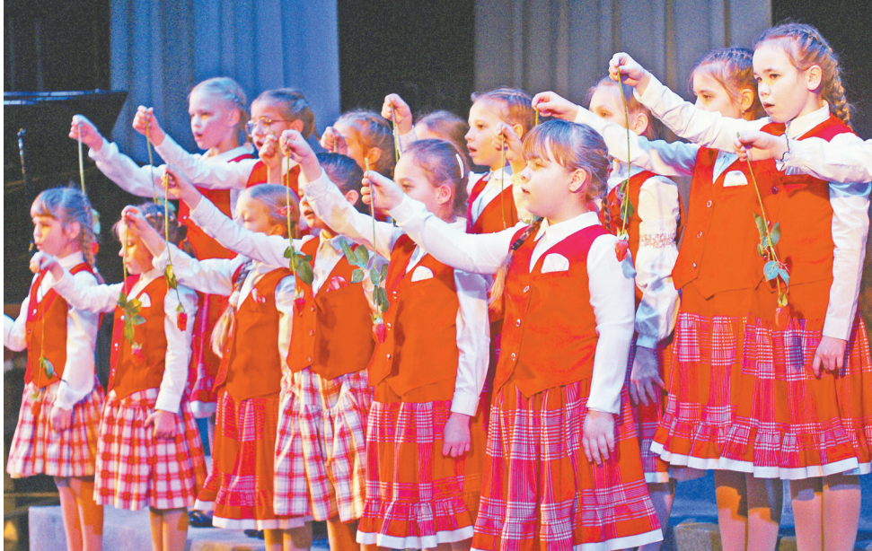
Кандидатский хор девочек «Глория»