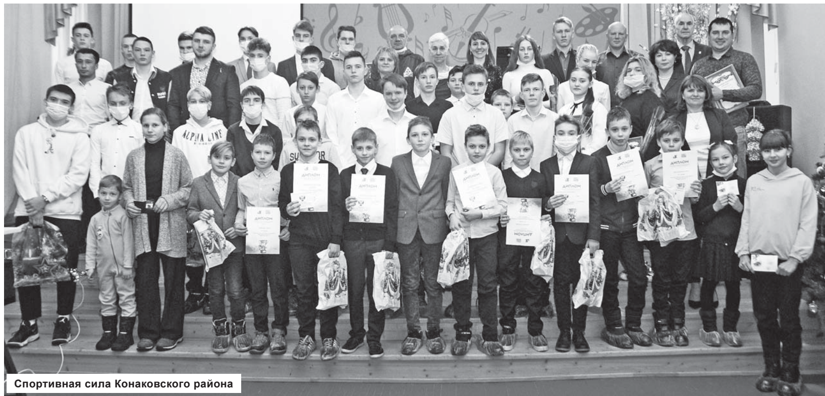
Спортивная сила Конаковского района