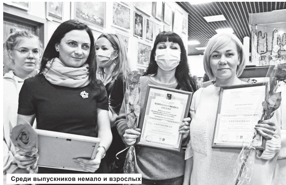
Среди выпускников немало и взрослых

надежда, что двухсотлетний промысел производства художественной керамики, существующий в нашем районе, будет поддержан и следующими поколениями!