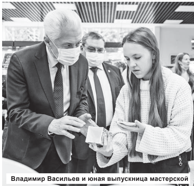
Владимир Васильев и юная выпускница мастерской

В самый канун новогодних праздников в производственной компании «Конаковский фаянс» состоялся первый выпуск «Мастерской художественных промыслов». Поздравить свежиспеченных мастеров фаянса приехал депутат Государственной думы Владимир Васильев.