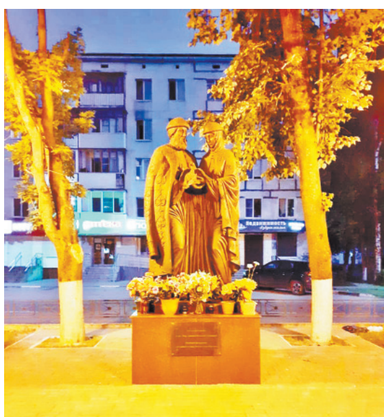
8 июля, 2021 год. Скульптура Петра и Февронии. Город Конаково.