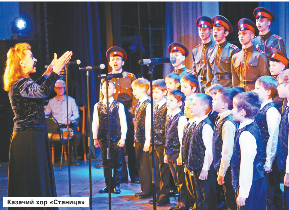
Казачий хор «Станица»